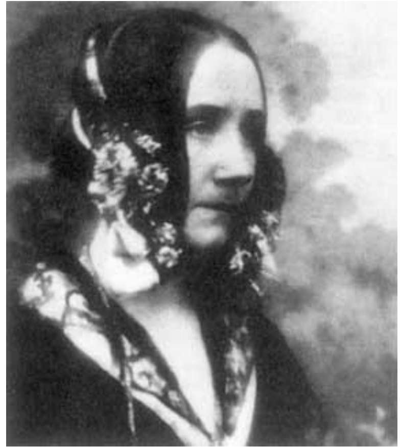
Asi 35 ročná (okolo 1850)